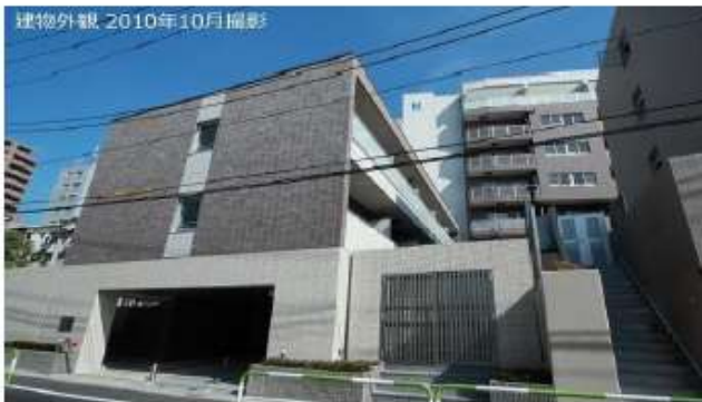
建物外観 2010年10月撮影